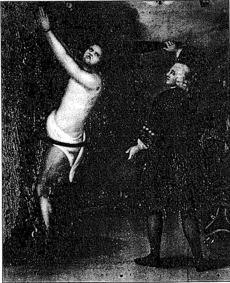
“Boome Schenders Straf” Olieverf op hout (Noordbrabants Museum 's-Hertogenbosch)