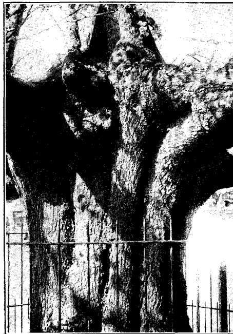
De stam van den Tilburgschen Lindeboom van nabij gezien.