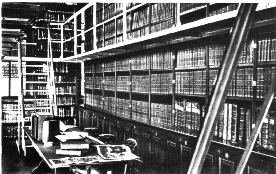
TILBURG - Een kijkje in de bibliotheek van het Moederhuis, zoals die was tot juli 1962.

gregatie in Nederland tot gevolg dat er steeds minder gestudeerd wordt en de Centrale Bibliotheek haar functie grotendeels verliest. Het generaal bestuur, in samenspraak met het provinciaal bestuur Nederland, ziet zich voor een groot probleem geplaatst: grote ruimtes worden in beslag genomen door een boekenbestand dat voor de congregatie nog maar weinig nut heeft en waarvan ook personen van buiten - ondanks een paar pogingen in die richting - slechts zelden gebruik maken. Het wordt steeds duidelijker dat in stand houden van de bibliotheek geen zin heeft. Per 1 januari 1980 wordt de aanschaf van boeken stopgezet. Tevens wordt besloten, in te gaan op een verzoek van het Dekenaat Tilburg-Goirle en de leeszaalruimte ter beschikking te stellen voor een dekenaal centrum (1980)