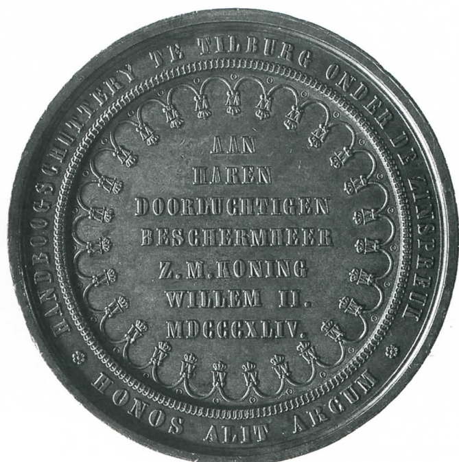
Voor- en keerzijde van de bronzen penning, uitgegeven door de op 16 september 1844 opgerichte handboogschutterij van de Philharmonie 'Honos alit arcum', ter ere van haar beschermheer koning Willem II (penning coll. Gemeentearchief Tilburg).

gustus 1831, als ze in Tilburg haar uit België van de veldtocht teruggekeerde echtgenoot heeft opgewacht, het moment van haar aankomst hier is vereeuwigd op een heel fraai schilderijtje, schrijft ze uit Den Haag aan broer Nicolaas: "Ik had je uit Tilburg willen schrijven, lieve vriend, maar de tijd ontbrak me. ... De twee dagen in Tilburg waren de gelukkigste van mijn leven, en de dag waarop Willem terugkeerde naar 's-Gravenhage was al wat de hemel in zijn oneindige genade een mens aan liefde en ontroering kan schenken." Hoe moeten we dit nu verstaan? Was de hereniging van Anna met haar Willem in Tilburg zoiets als de eerste hemel en de terugkeer naar Den Haag de zevende? In de regels die volgden staat de oplossing. Vanaf Breda tot in Holland juichten de mensen voor Rusland, voor haar broer Tsaar Nicolaas en voor de geboorte van diens zoveelste zoon. Haar eigen huis en land bleven bij Anna datgene waar alles om draaide.