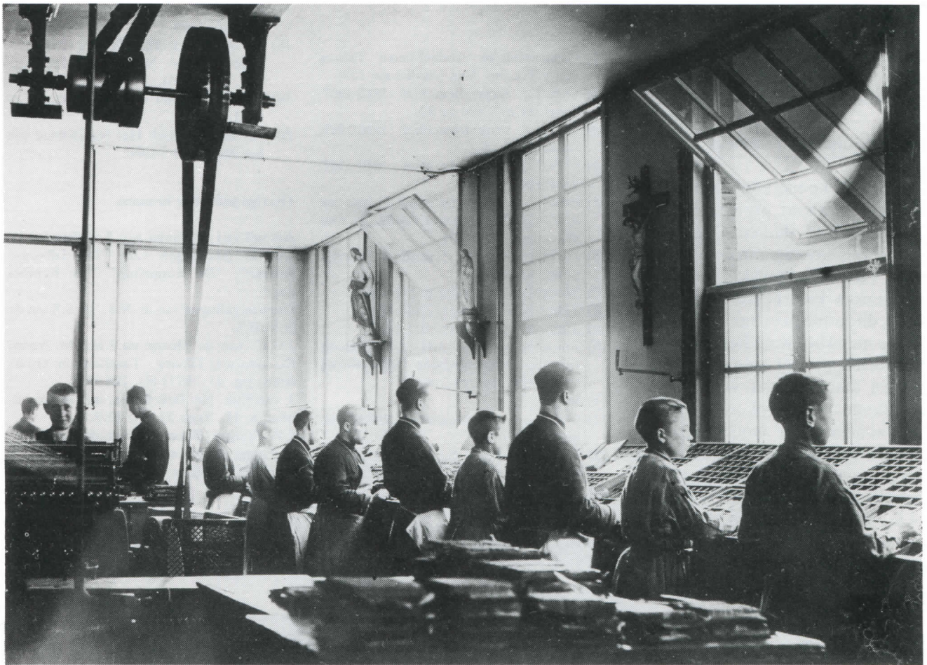
Drukkerij R.K. Jongensweeshuis

gaat dan, zoals toen gebruikelijk was, ergens in de kost. Zeer waarschijnlijk bleef hij de volgende jaren op de drukkerij werken. Acht jaar later voltrekt zich een grote verandering: ". . .op het einde van 1865, met toestemming mijner overheid en ook UDH's goedkeuring, probeerde [ik] mij als Drukker te vestigen met de centen van eenige notabelen dezer stad. Die centen zijn reeds eenige jaren afgelost en de Drukkerij is het eigendom van mij en mijne zuster geworden."