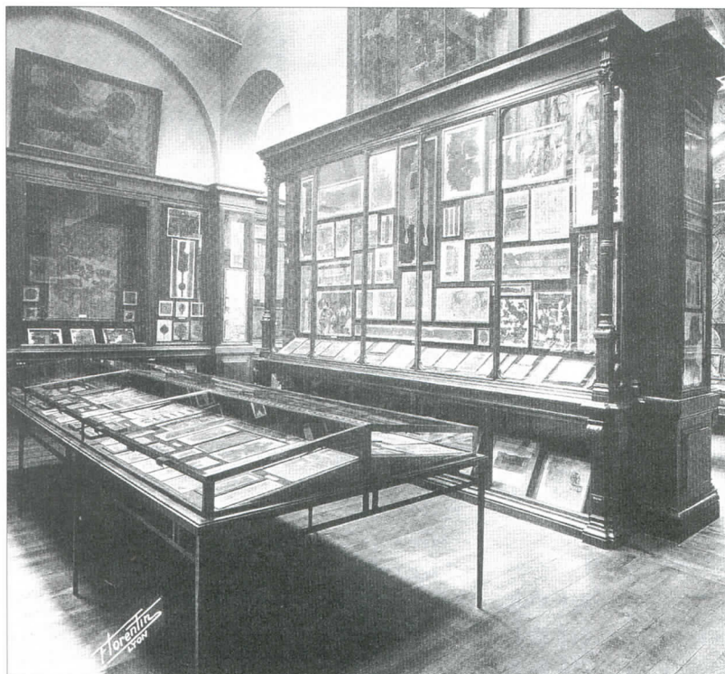
Het textielmuseum (Le Musée des Tissus) van Lyon in het begin van de twintigste eeuw.

Ze was van mening dat ze niet een getrouw beeld van de Tilburgse textielindustrie kon geven omdat 'al deze verouderde Machineriën en gereedschappen bereids onder sloophamers zijn verdwenen.' Verder waren verschillende fabrikanten van mening dat deelnemen aan de tentoonstelling meer nadeel dan voordeel zou hebben. Men zag geen direct eigenbelang en was niet gevoelig voor promotionele argumenten. Uiteindelijk zou wel meegedaan worden, hoewel diverse grote textielbedrijven ontbraken, en kreeg de tentoonstelling toch allure door deelname van buitenlandse constructeurs van machines en hulpmiddelen. 7 Interessant aan dit verhaal is dat de Tilburgse elite van textielabrikanten een tentoonstelling niet beoordeelt op haar culturele betekenis, maar het beoordeelt op haar economische waarde. Een mogelijke discussie over een Textielmuseum lijkt dan heel ver weg, tenzij er een formule te bedenken valt waar museum en industrie elkaar om economische redenen weten te vinden.