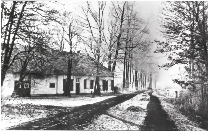
De Baars gelegen onder Enschoot nabij het Baksven, jaren dertig van de vorige eeuw. (Coll. RAT).

wasserijen waren gesitueerd tussen de Oude Leij en de Nieuwe Leij. Zo konden ze hun afvalwater lozen op de Oude Leij, waardoor de fabriek ook verder stroomafwaarts nog steeds schoon water uit de Nieuwe Leij kon betrekken. In Moerenburg kwamen beide beken weer bij elkaar om daarna als Voorste Stroom richting Oisterwijk te stinken. In 1934 stroomde na een wolkbreuk het hoge water van de beek in de plas de Buunder (Grollegat), hetgeen onmiddellijk leidde tot massale vissterfte. 5 Op diverse plekken zijn later ook niet toevallig hoge concentraties aan zware metalen vastgesteld. In zekere zin was Moerenburg de plek van de eerste grote milieuproblemen in Tilburg. Wat is uitgerekend hier niet allemaal gestort in de moerassen, oude veenputten en natte weiden! 'Er staan weliswaar bordjes verboden toegang', zo schreef Pierre van Beek, 'maar dat lijkt meer uitnodiging dan verbod.' 6