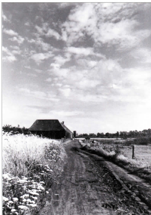
De Moerenburgseweg is in 1952 nog een zandpad.

Wat hij als paradijselijk beleefde was echter vooral, zo niet uitsluitend, het gecultiveerde, door mensenheden aangeplante groen direct rond Huize Moerenburg. Over een paradijselijke beleving van de wijde, meer natuurlijke omgeving moeten we ons niet te veel illusies maken. Oude namen in de omgeving, zoals 'Helleputten' en 'Galgeven' getuigen eerder van heel andere associaties. Toch zou het landschap van toen voor de natuurliefebber van nu een paradijselijke ervaring zijn geweest. Maar monniken en pachters van de abdij van Tongerlo hadden een ander paradijselijk visioen: ontginning. Onderdeel van een Moerenburgs pachtcontract in de 17e eeuw was niet toevallig 'jaarlijks 10 roeden ontginnen van de quaede weij'. 4 En ongetwijfeld was die 'quaede weij' volgens de huidige maatstaven een natuurjuweel van de eerste orde. Maar ten aanzien van dat soort waarden was Moerenburg tot in onze moderne tijd het toneel van een opvallende rauwheid en onverschilligheid. Het riviertje de Oude Leij veranderde zowel in naam als bestemming in 'de Vuile Leij'. Veel ververijen en wol-