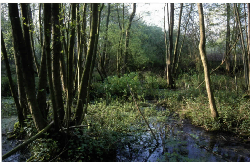
Blik in het natte broekbos waar de Leij onder de A 58 doorgaat. Zo zagen delen van Moerenburg er waarschijnlijk al in de Middeleeuwen uit.

Voor Kieviten, kauwen, spreeuwen en houtduiven is er nu meer te halen. Ze slapen ook vaak in grote groepen in het gebied. Houtduiven prefereren daarbij een aangeplant sparrenbosje van een coniferenkweker. Ook groepen spreeuwen slapen daar soms. Zo dragen ook aangeplante sparren bij aan de totale natuurrijkdom in Moerenburg. De variatie in het gebied is extra bevorderd door de aanplant van vele inheemse en uitheemse bomen, struiken en kruiden.