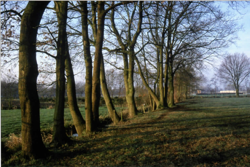
Oude eikenwal tussen de sportvelden van Were Di en de Koebrugse weg. (Foto Henk Kuiper).

van die oude rijksweg naar Eindhoven! In de oorspronkelijke, aaneengesloten Leijmoerassen was nergens een droog plekje voor een konijnenhol te vinden. Ook een oude vuilstort vormt nu een konijnenbolwerk in voorheen voor konijnen onbegaanbaar moeras. Nog meer lijken bepaalde vogelsoorten te hebben geprofiteerd van de moderne ontwikkelingen. Op de gegraven plassen broeden tegenwoordig futen en kuifeenden en grote delen van het jaar zijn er aalscholvers te zien, mede dankzij binnegestroomde meststoffen en het uitzetten van grote hoeveelheden vis. Steeds vaker ook laten ijsvogels zich bewonderen. Dat is niet alleen het gevolg van zachte winters, maar ook van de toegenomen hoeveelheid geschikt viswater. En zag je in het verleden de buizerd alleen in de winter, er broeden nu jaarlijks meerdere paren. Is dat alleen te danken aan minder vervolging en minder zware gifstoffen in de landbouw? Waarschijnlijk is die bonte mix van allemaal verschillende landschapselementen ook wel buitengewoon aantrekkelijk voor de buizerd. Zo heeft hij alles bij de hand en misschien waardeert hij wel in het bijzonder de snelweg vanwege de aangereden dieren die hier ter consumptie worden aangeboden. Diverse vogelsoorten zijn ook duidelijk talrijker geworden door de veel zwaardere bemesting van het land.