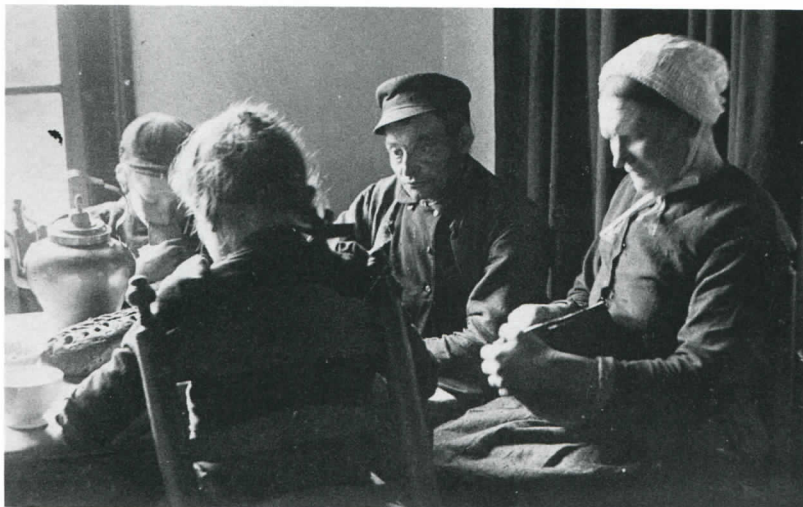
afb. 5 Het leven op het Tilburgse 'platteland'. Roggebrood behoorde met aardappels tot het hoofdvoedsel van de volksklasse.

het voedsel op de dinsdagse of vrijdagse markt kocht, kreeg met hogere prijzen te maken. In het tijdvak juli 1867 tot en met mei 1868 was bovendien de prijs van een roggebrood meer dan 50 % hoger dan normaal. Van 25 cent (normaal) die (gemiddeld) in 1866 voor een drieponds roggebrood betaald moest worden, steeg de prijs via ongeveer 30 cent in 1867 tot 40 cent in 1868. De H. Geest Armen en Vincentius vormden het karige vangnet voor hen die niet of nauwelijks in hun onderhoud konden voorzien.