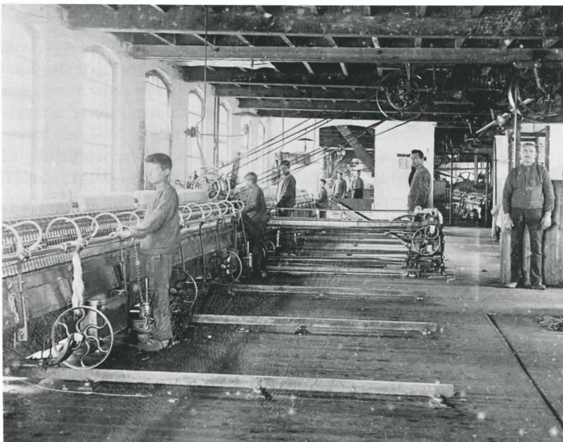
afb. 2 Werkende kinderen aan de selfactors (spinmachines) bij Gebrs. Diepen.

In Tilburg waren volgens een staat die op het einde van 1866 is opgemaakt 35 wollenstoffenfabrieken die aangedreven werden door stoomkracht. Daarnaast waren er nog 65 die bij de productie geen gebruik maakten van stoomwerktuigen. In deze fabrieken, soms