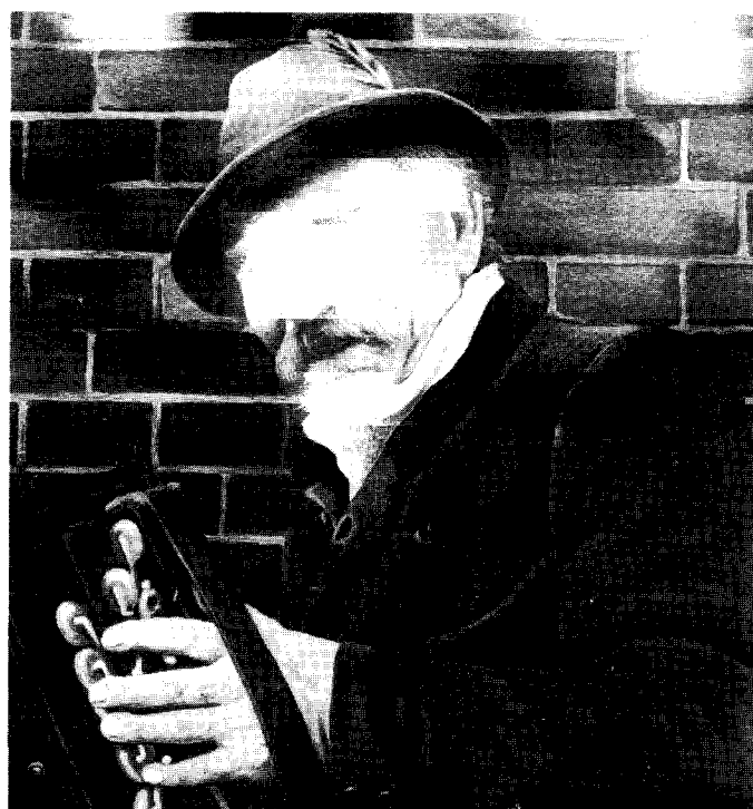
afb. 7 A/B: (l) foto Veldman, (r) schilderij Van Rijswijk