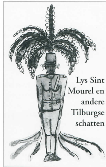
Lys Sint Mourel en andere Tilburgse schatten