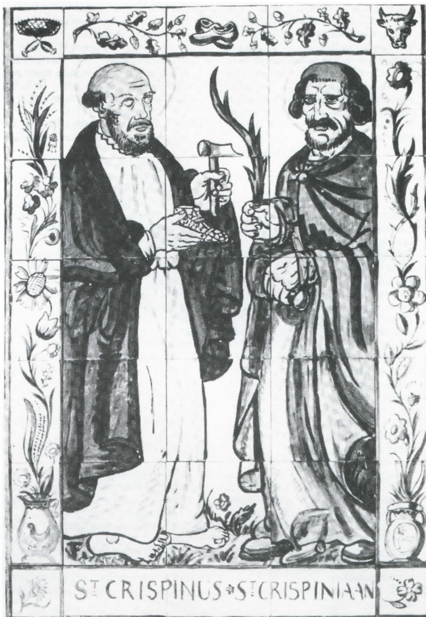
(coll. Gemeentearchief Waalwijk. Zie uitleg noot 2)

Het beste is het gilde te interpreteren als een sociale en kulturele vereniging, enerzijds gericht op ontspanning, anderzijds op onderlinge