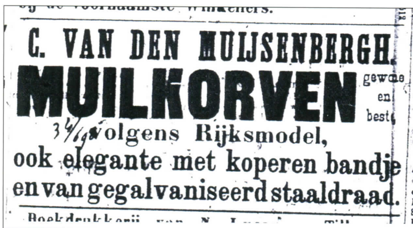
Advertentie uit de Tilburgsche Courant van 29 december 1892.

Eerlijk gezegd is het onduidelijk of het een hond is van hem of van zijn vader.