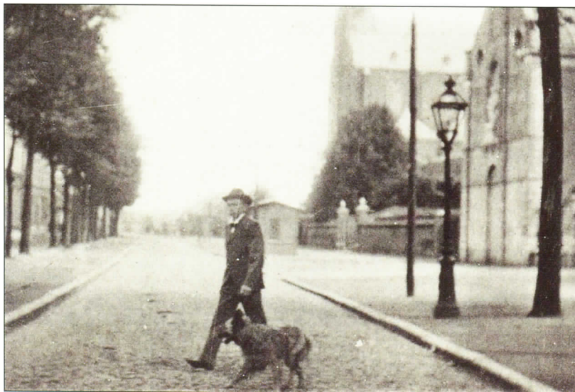
Man met hond in de Goirkestraat in 1910.

een pad maakt. Echt belangrijk vind je het vermoedelijk niet, je vraagt de politie om ze " eerst maar 'ns te waarschuwen. " 14 Ik las er verder niets meer over. Christiaan Mommers, een baas, verzoekt namelijk niet.