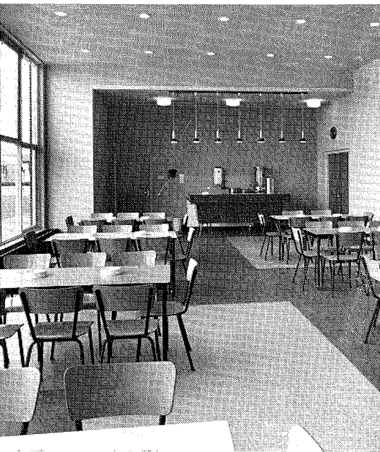
Kantine met pantry. Links een heerlijk ruim uitzicht. Men lette ook hier weer op de zorgvuldige dosering van lampen en kunstlicht.