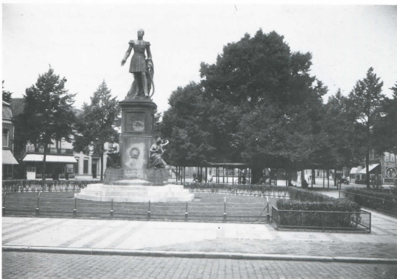
Afb. 6 Het standbeeld van koning Willem II en de lindeboom staan al sinds 1924 gebroederlijk naast elkaar op de Heuvel (foto ca. 1930).

Daarna is zijn hoofd afgehouden en enige uren op een pin tentoongesteld. Zo ging dat in die dagen met struikrovers.