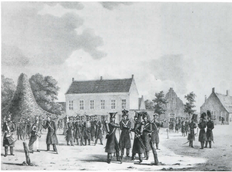
Afb. 1 De Hoofdwacht op de Heuvel met Utrechtse Vrijwillige Jagers tijdens de Tiendaagse Veldtocht in 1831. De lindeboom was, volgens Elise van Calcar, als een 'Chinese parasol' geknipt.