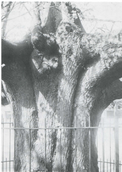
Afb. 5 Met een beetje goede wil kon men in 1930 de beeltenis van Maria en het Kindje Jezus nog in de stam ontwaren.