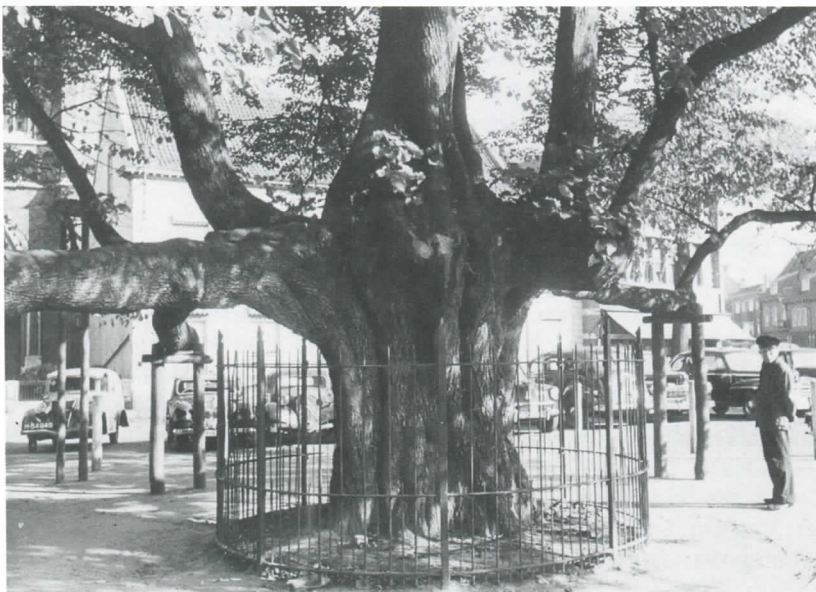
Afb. 7 IJzeren hekwerk om de stam van de lindeboom in 1948.

Lindeboomliehebbers hebben zich in de Tweede Wereldoorlog vaak afgevraagd, hoe de boom uit de strijd zou komen. Er is slechts een incident bekend. Na de bevrijding reed een Canadese vrachtwagen bij het achteruitrijden er een forse tak af.