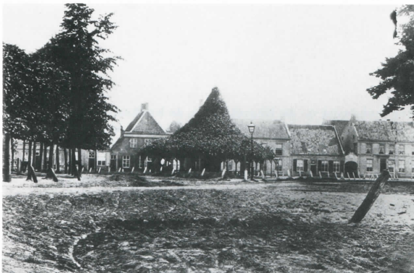
Afb. 2 De oudste foto van de lindeboom omstreeks 1850/1860. Op de plaats van de gebouwen links op de achtergrond bevindt zich thans de Heuvelpoort. Rechts herberg De Gouden Zwaan (coll. Bodel Nijenhuis, Universiteitsbibliotheek Leiden).

der de kroon ontstaan een nieuwe boom gevormd kan worden, waarvan de takken weer tot een etage-linde, zoals de linde er vroeger uitzag, geleid en gesnoeid kunnen worden. Er is dan wel meer ruimte rondom de stam nodig en de rijweg zal versmald of opgeschoven moeten worden. Dit gaat geheel tegen de actuele gemeentelijke plannen in. Een alternatief is volgens hem het kiezen voor een grotere kroon die de boom de komende tientallen jaren weer zou kunnen vormen.