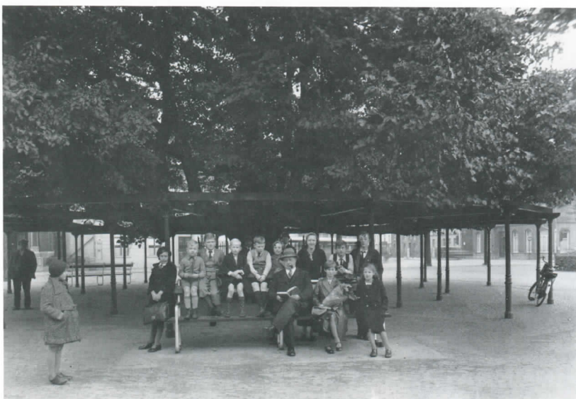
Afb. 4 In 1935 werd onder de lindeboom een rustbank geplaatst.