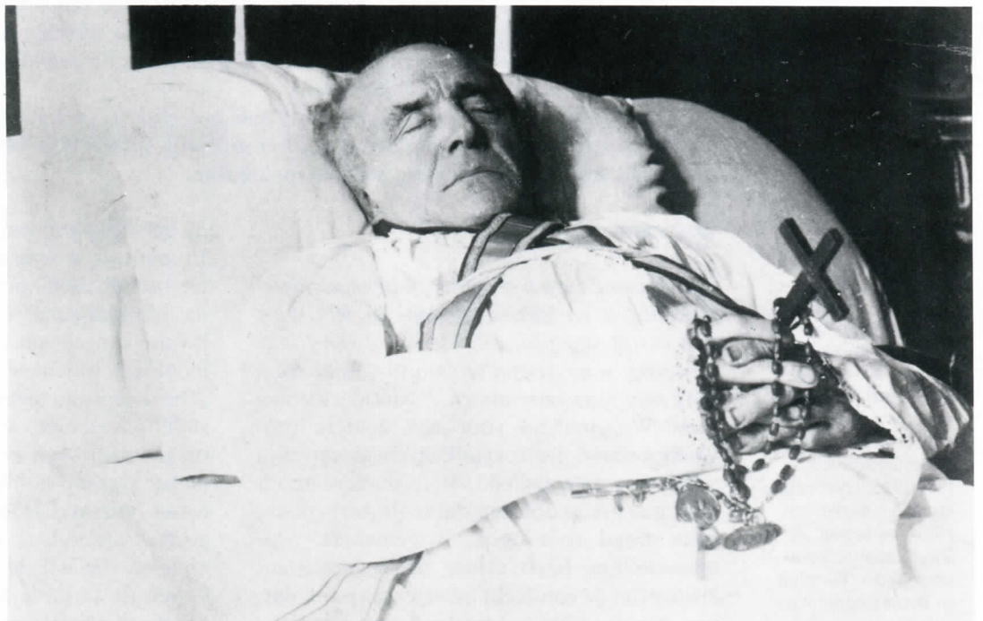
afb. 5 Guido Gezelle op zijn sterfbed, Brugge 27 november 1899 (foto Archief en Museum voor het Vlaams Cultuurleven, Antwerpen).